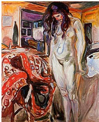
Djevojka pored stolice