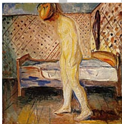
Djevojka koja plače