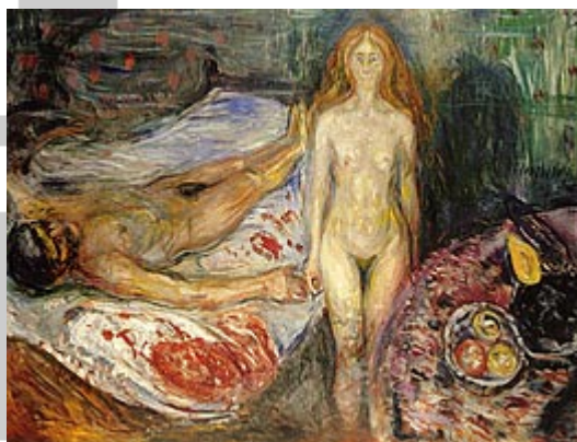
Ubijeni Mara II