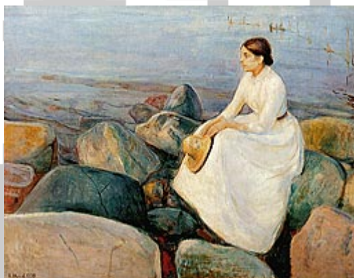
Inger na obali