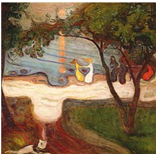
Ples na morskob obali