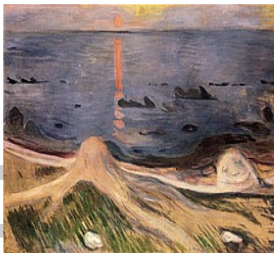
Misterija ljetne noći