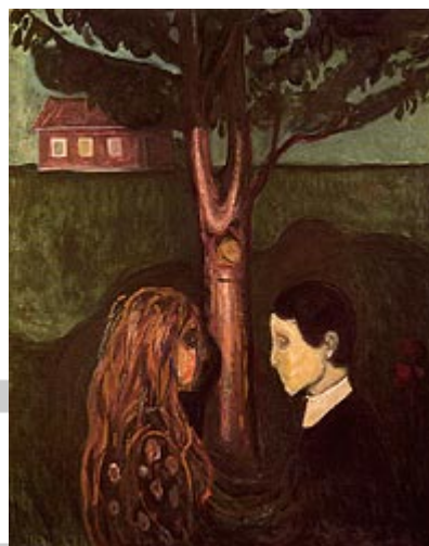
Oči u oči