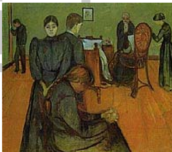
Smrt u bolesničkoj sobi