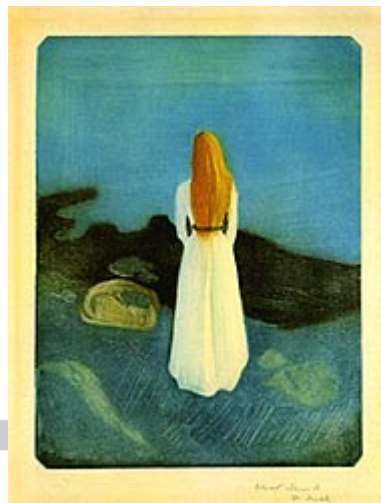
Djevojka na obali