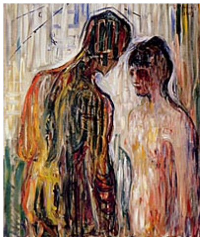
Ljubav i psiha