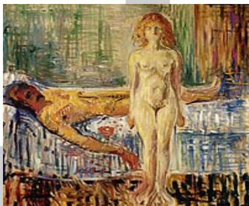
Ubijeni Mara I