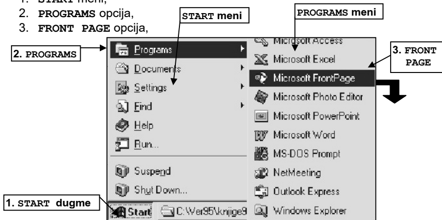
Slika 2.1. START meni