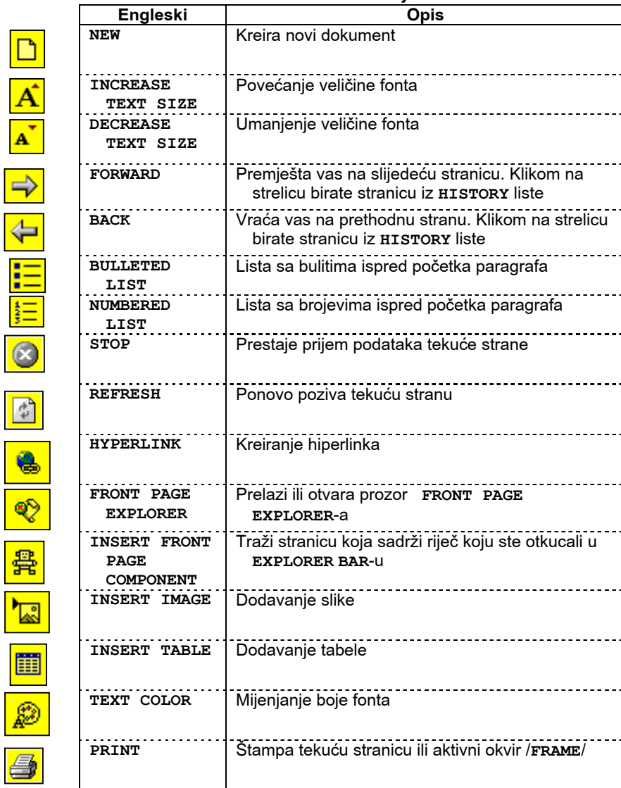
Tabela 3.2. Dijelovi STANDARD TOOLBAR-a